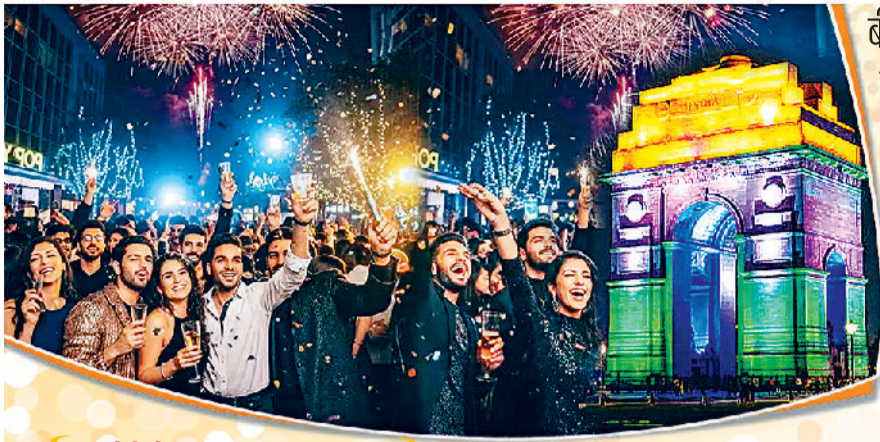
सेलिब्रेशन / लोकमित्र गौतम

साल 2025 विदा होने वाला है। इसके साथ ही नया साल 2026 आने के लिए तैयार है। बीते साल की विदाई और नए साल के स्वागत में पूरी दुनिया में दिसंबर माह के आखिरी सप्ताह में जश्न का माहौल रहता है। अपने देश में भी क्रिसमस के बाद सड़कों पर शाम होते ही रोशनी जगमगाने लगती है। बाजारों में चहल-पहल बढ़ जाती है और हर जगह अलविदा-ए-जश्न के रंग-बिरंगे पोस्टर चस्पा हो जाते हैं। वास्तव में अब नए वर्ष का स्वागत, धर्म-समुदाय से ऊपर उठकर साझे जश्न का पर्व बनकर उभरा है। यही कारण है कि उत्तर से दक्षिण और पूर्व से पश्चिम तक दुनिया के हर कोने में 31 दिसंबर की रात जश्न की रात होती है। हर साल की तरह इस साल भी नए साल के स्वागत में जश्न मनाने के लिए तैयार देश के कई शहर खासतौर पर तैयार हो रहे हैं।