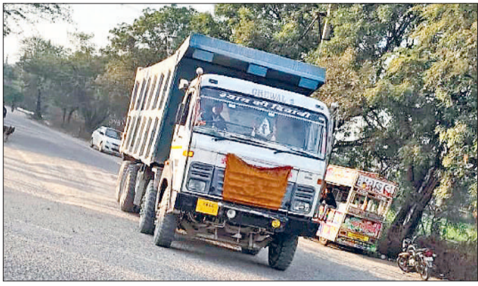
नारनौल। कुलताजपुर रोड से आता भारी वाहन, 1 जनवरी से होगी नो-एंट्री।

आदेशों में यह भी स्पष्ट किया गया है कि महेन्द्रगढ़ शहर के अधिकार क्षेत्र, परिधीय सड़कों और बाईपास आदि पर भारी वाहनों द्वारा ओवरटेकिंग पूरी तरह प्रतिबंधित रहेगी और इन सड़कों को 'नो ओवरटेकिंग जोन' घोषित किया गया है। इन आदेशों की अहमदगी करने वालों के खिलाफ हरियाणा पुलिस अधिनियम, 2007 की धारा 72 के तहत सख्त कार्रवाई की जाएगी, जिसमें छह महीने तक की कैद और दस हजार रुपये तक के जुर्माने के साथ-साथ मोटर वाहन अधिनियम के तहत अतिरिक्त दंड का प्रावधान है।