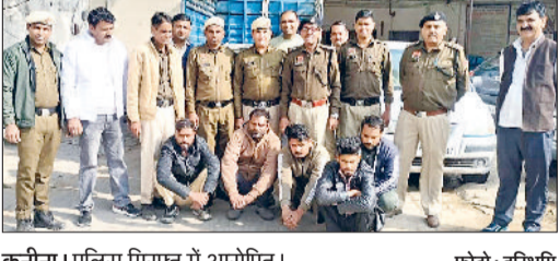
कनीना। पुलिस गिरफ्त में आरोपित।

कनीना। कनीना-नारनौल सड़क मार्ग पर फिलिंग स्टेशन सुंदरह के समीप टूटी सड़क के कारण दो दोपहिया वाहनों के बीच हुई आमने-सामने की टक्कर में तीन व्यक्ति घायल हो गए। जिन्हें उपचार के लिए महेन्द्रगढ़ अस्पताल में दाखिल कराया गया। जहां उनकी हालत में सुधार बताया गया है।