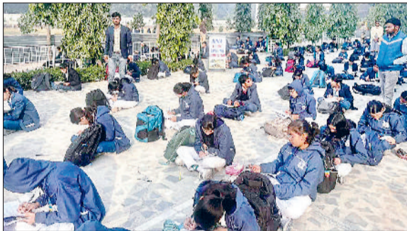
महेंद्रगढ़। प्रतियोगिता में भाग लेते विद्यार्थी।

यदुवंशी स्कूल में विद्यार्थियों की रचनात्मक क्षमता और लेखन कौशल को निखारने के उद्देश्य से निबंध लेखन प्रतियोगिता आयोजित की गई। इस प्रतियोगिता में विद्यार्थियों ने भाग लिया। प्रतियोगिता के विषय पर्यावरण संरक्षण, डिजिटल इंडिया, अनुशासन का महत्व, मेरा आदर्श जैसे महत्वपूर्ण विषय शामिल थे। विद्यार्थियों ने अपने विचारों को स्पष्ट, सुंदर और प्रभावशाली लेखन में प्रस्तुत किया। प्रतियोगिता का मूल्यांकन विद्यालय के अनुभवी शिक्षकों द्वारा किया गया। कार्यक्रम के अंत में चयनित विद्यार्थियों को प्रमाण पत्र देकर सम्मानित किया गया। यदुवंशी ग्रुप के चेयरमैन एवं