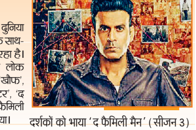
दर्शकों को भाया 'द फैमिली मैन' (सीजन 3)

बीते कुछ वर्षों में एंटरटेनमेंट की एक समानांतर बुनिया विकसित हुई है। इन दिनों थिएटर में रिलीज फिल्मों के साथ-साथ ओटीटी शो को भी दर्शकों का खूब प्यार मिल रहा है। 'द बैड्स ऑफ बॉलिवुड', 'ब्लैक वॉटर', 'पाताल लोक (सीजन 2)', 'पंचायत (सीजन 4)', 'मंडला मर्डर्स', 'खौफ', 'स्पेशल ऑप्स (सीजन 2)', 'आका: द बंगल चैप्टर', 'द फैमिली मैन (सीजन 3)' और 'किंगडम जस्टिस: ए फैमिली मैट्ट' जैसे ओटीटी शो को दर्शकों ने खूब पसंद किया।